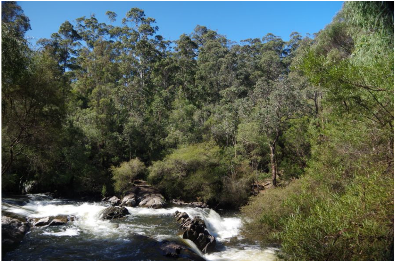
die Stromschnellen im Lefroy-Brook

sich gelassen hat, ist der Bibbulmun-Track ausgeschildert. Der Weg ist von mächtigen Karribäumen gesäumt. Etwa vier Kilometer nach dem Ausgangspunkt steht man vor dem Gloucester Tree (GPS: S34°26.871, E116°03.436). Der Baum kann über lange Bolzen, die ins Holz geschraubt sind, bestiegen werden. In etwa 50 Metern Höhe befindet sich eine Plattform, die früher der Brandwache diente. Vom Parkplatz am Gloucester Tree starten drei Rundwege, die allesamt in die beeindruckende Pflanzenwelt des Nationalparks führen. Ein kurzer 400 Meter langer Loop (blaue Markierung) gibt hierbei einen ersten Einblick. Etwa 800 Meter lang ist der Karri View Loop (grüne Markierung); er führt an einigen prächtigen Exemplaren dieser Spezies vorbei. Ein weiterer Rundweg von etwa 10 Kilometern Länge (schwarze Markierung) erschließt den gesamten nördlichen Teil des Gloucester NP.