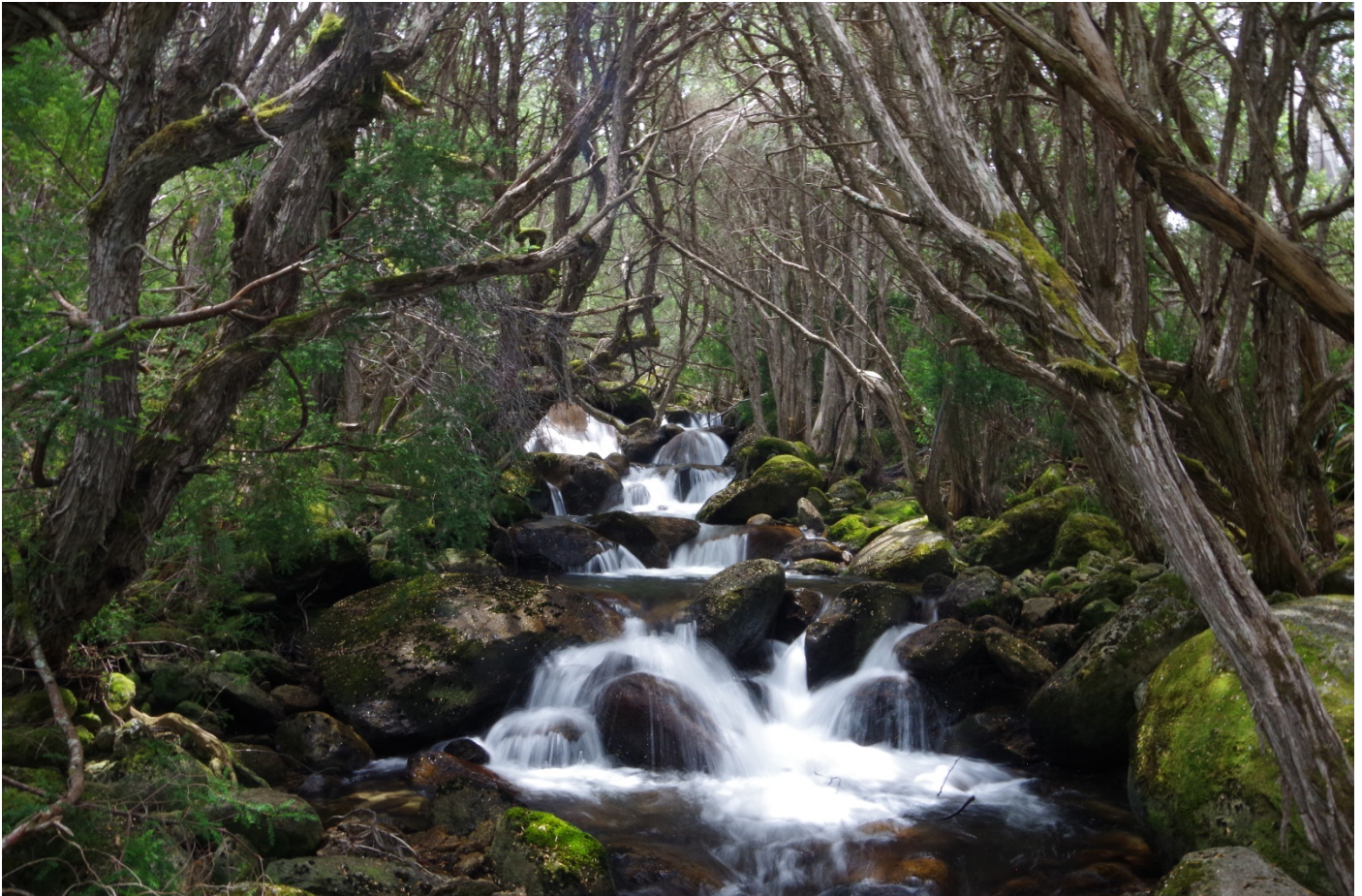
Rund um Thredbo rauschen glasklare Bäche durch die Wälder.

Übernachtungsmöglichkeiten: Camping und Hotels in Thredbo