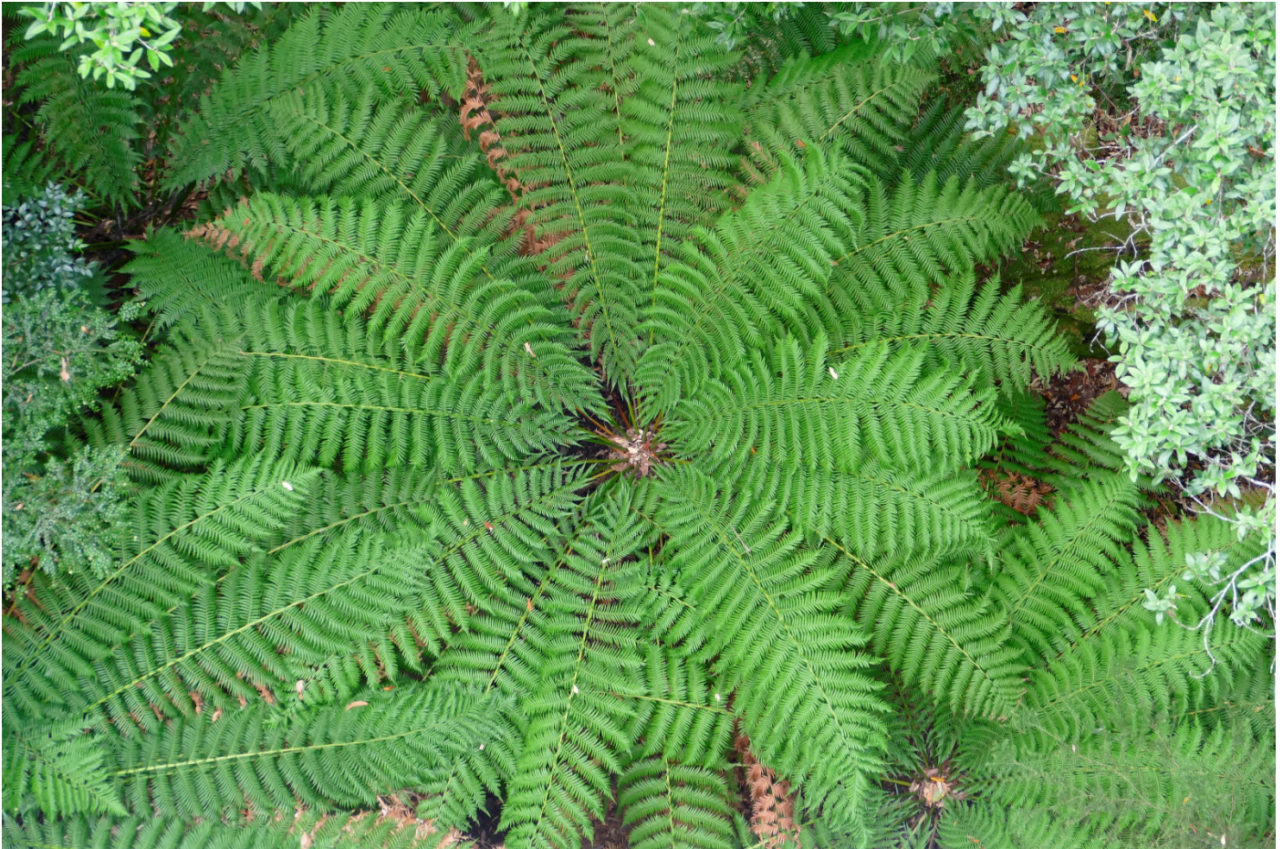
Blick vom Airwalk

Der Aufstieg zu dem beeindruckenden Baumkronenpfad beginnt am Wegpunkt S43 05.698, E146 43.649 und führt zunächst einige Stufen bis zum Eingang des Boardwalks hinauf. Dort kann man nach rund 130 Metern sein Glück mit einem Münzwurf versuchen. Dabei sollte das Geldstück den Baumstumpf zu treffen, der unterhalb des Boardwalks steht. Ein Großteil der Münzen fällt (leider) daneben und wird unten von findigen Besuchern sofort eingesammelt. Nach rund 600 Metern Spaziergang durch die Baumwipfel steht man auf einem Ausleger rund 50 Meter über dem Huon – River. Von hier ist der Rückweg zum Besucherzentrum ausgeschildert.