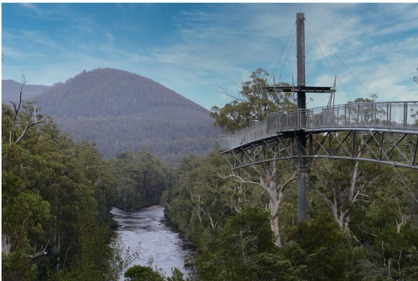
Blick auf die Mündung vom Picton River in den Huon River

Übernachtungsmöglichkeiten: Campingplatz und Lodge direkt am Besucherzentrum, hier sollte allerdings vorreserviert werden.