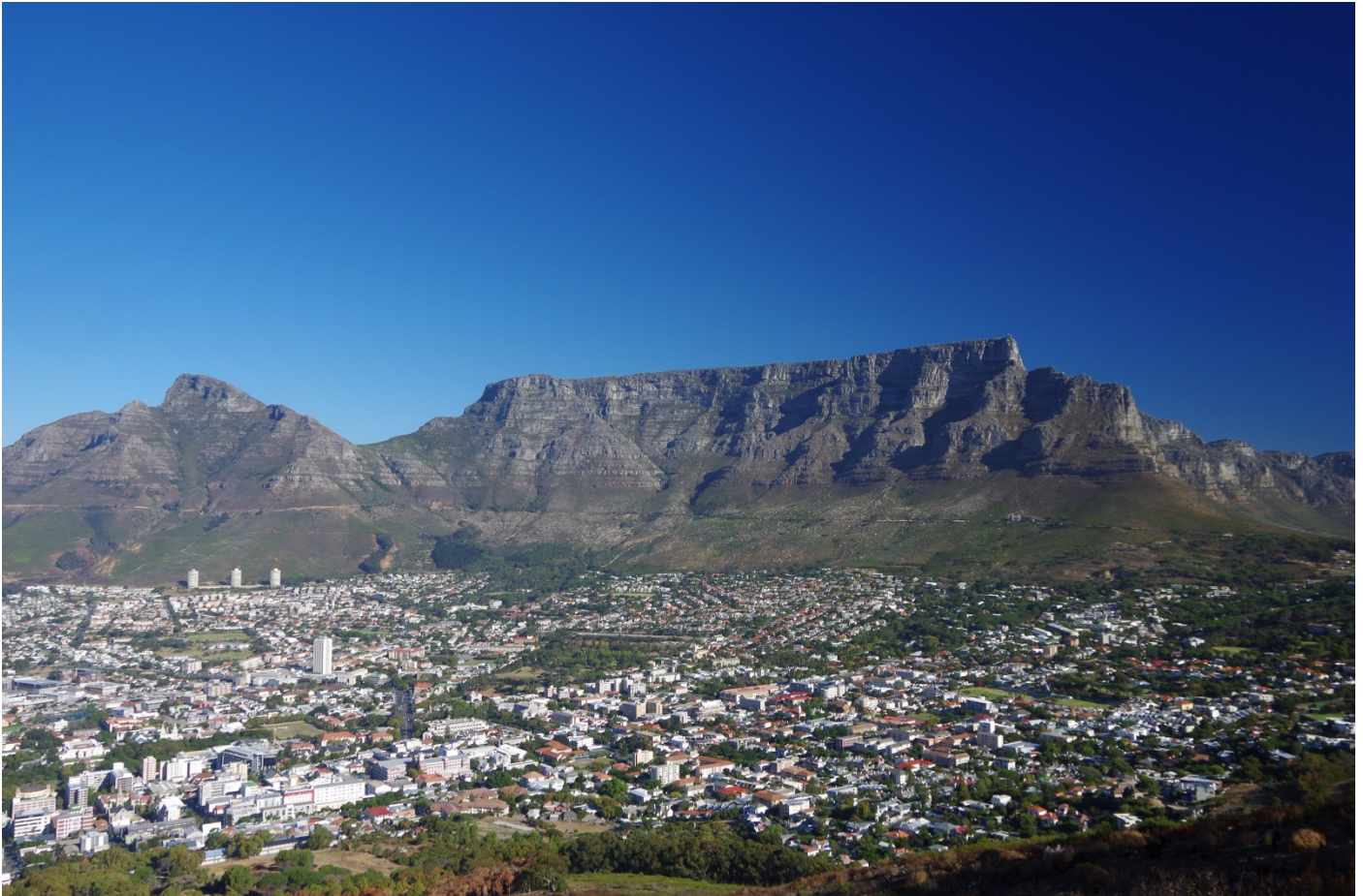
Ein begehrtes Wanderziel in Kapstadt ist der Tafelberg.

Übernachtungsmöglichkeiten: viele Einrichtungen in Kapstadt und Umgebung