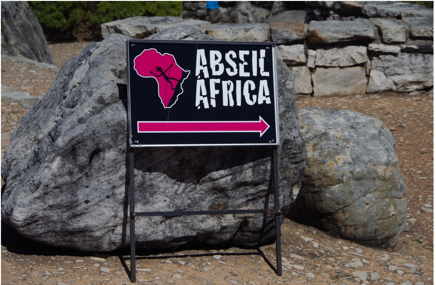
Auch vom Tafelberg hinunter gibt es viele Wege

Wer am Ende noch genuegend Kondition hat, der kann den Abstieg ueber dieselbe Route wie den Aufstieg angehen. Andernfalls empfiehlt sich aus anfangs erwaehnten Gruenden auch eine Fahrt mit der Seilbahn.