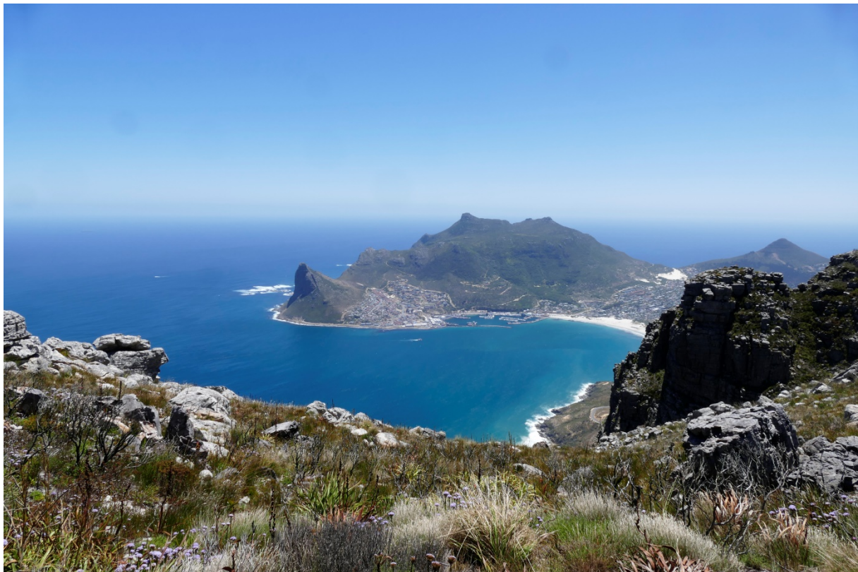
Der Ausblick vom Eagles Nest Lookout auf Hout Bay ist spektakulär.

Übernachtungsmöglichkeiten: viele Angebote in Kapstadt, Camping in Chapmans Peak Caravan Farm, Noordhoek