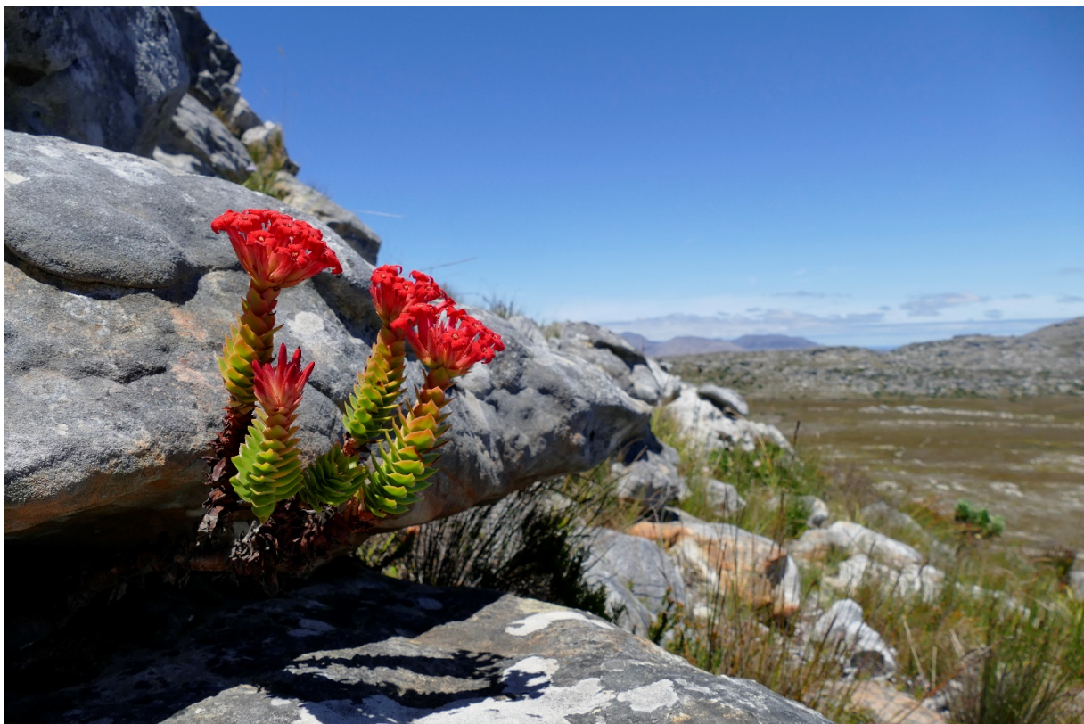
Sommerblumenpracht im Silvermine-Gebiet