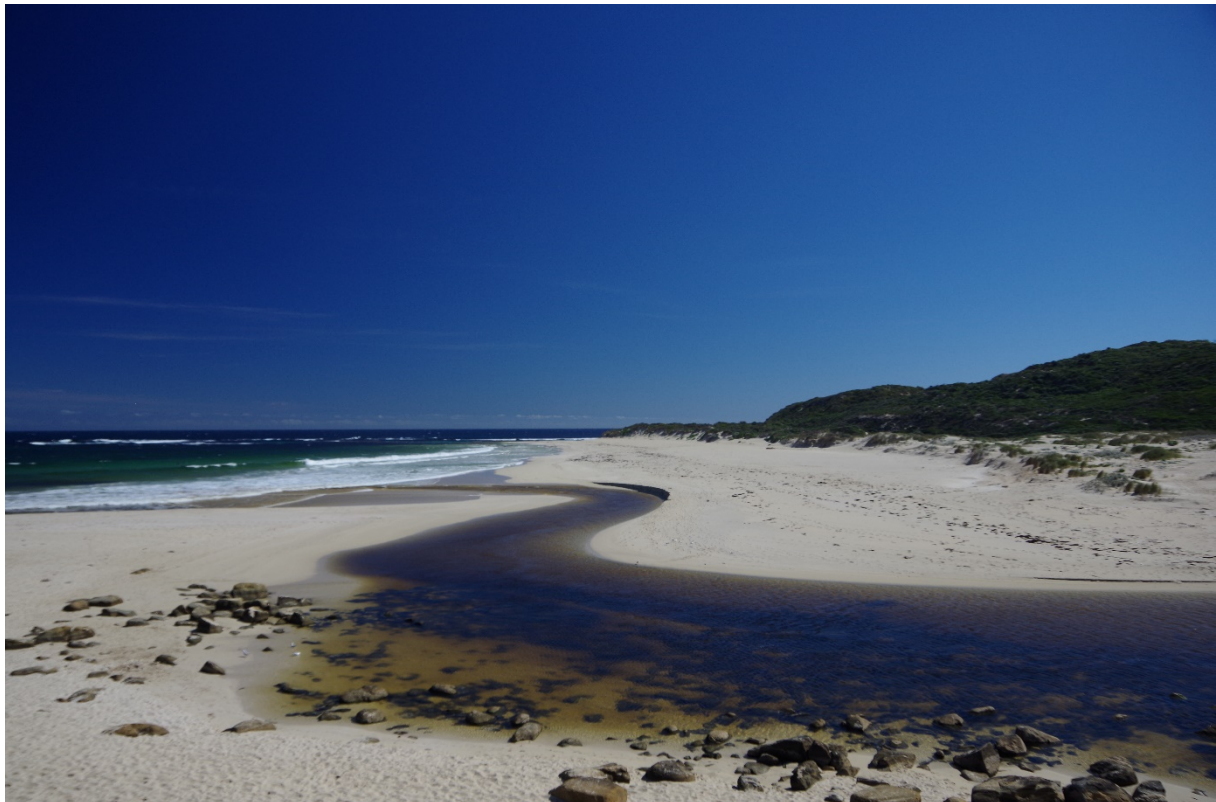
An seiner Mündung gelangt nur wenig Wasser des Margaret River ins Meer.

Übernachtungsmöglichkeiten: zahlreiche Unterkünfte von Camping bis Hotel in Margaret River