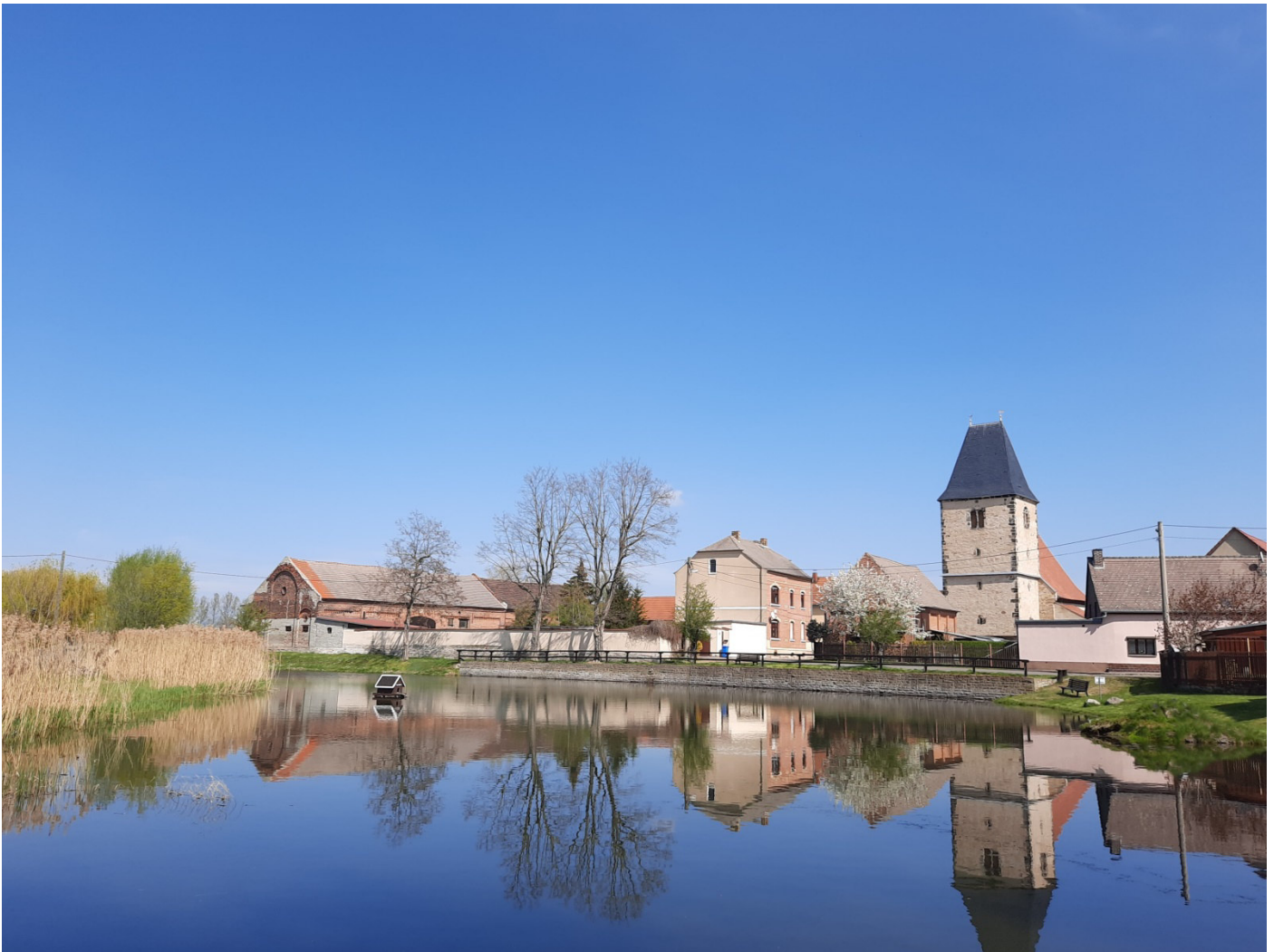
Dorfteich in Kreypa

Kirche biegt man nach links in Richtung Kleinliebenau ab und fährt durch den Ort weiter bis zur B186. Nach dem Überqueren der Bundesstraße gelangt man geradeaus auf bequemen Waldwegen nach Burghausen. Hier trifft man erneut auf den Elster-Saale Kanal (GPS: N51° 21.354' E12° 15.462'), dem man nun in östliche Richtung bis zum Ausgangspunkt der Tour folgt.