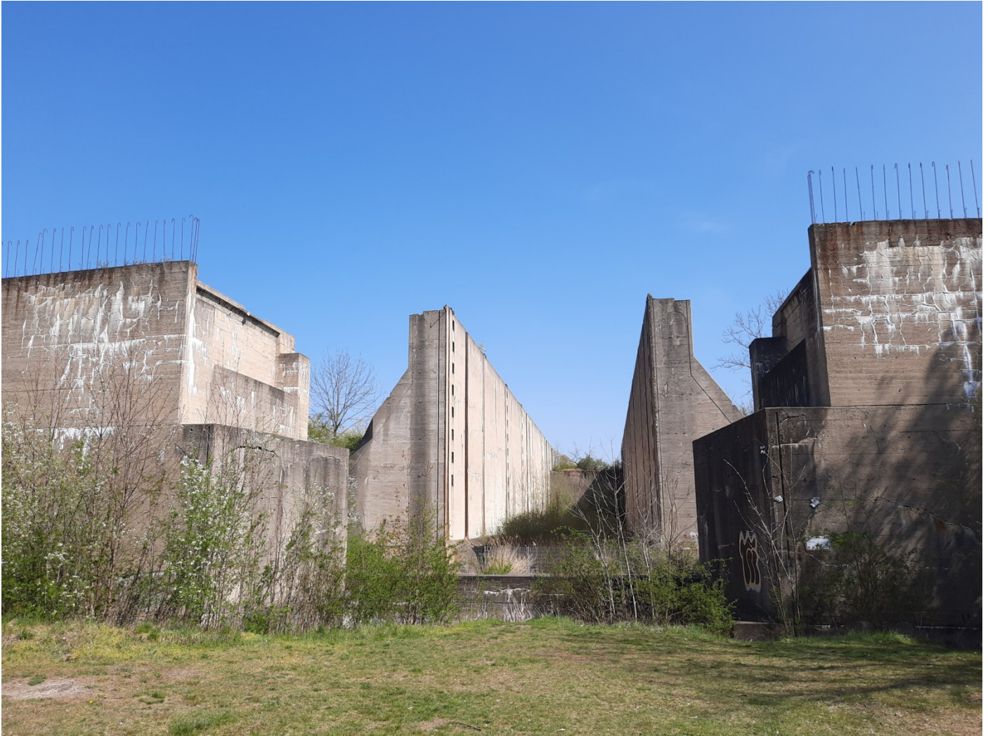
Schleusenbauwerk in Wüsteneutzsch

Am Ende des Kanals folgt man dem Feldweg weiter in westliche Richtung entlang des „Rohbaus“ vom nicht fertig gestellten Teil des Kanals. Nach ca. 6 Kilometern gelangt man zu den beeindruckenden Betonruinen der Schleuse von Wüsteneutzsch.