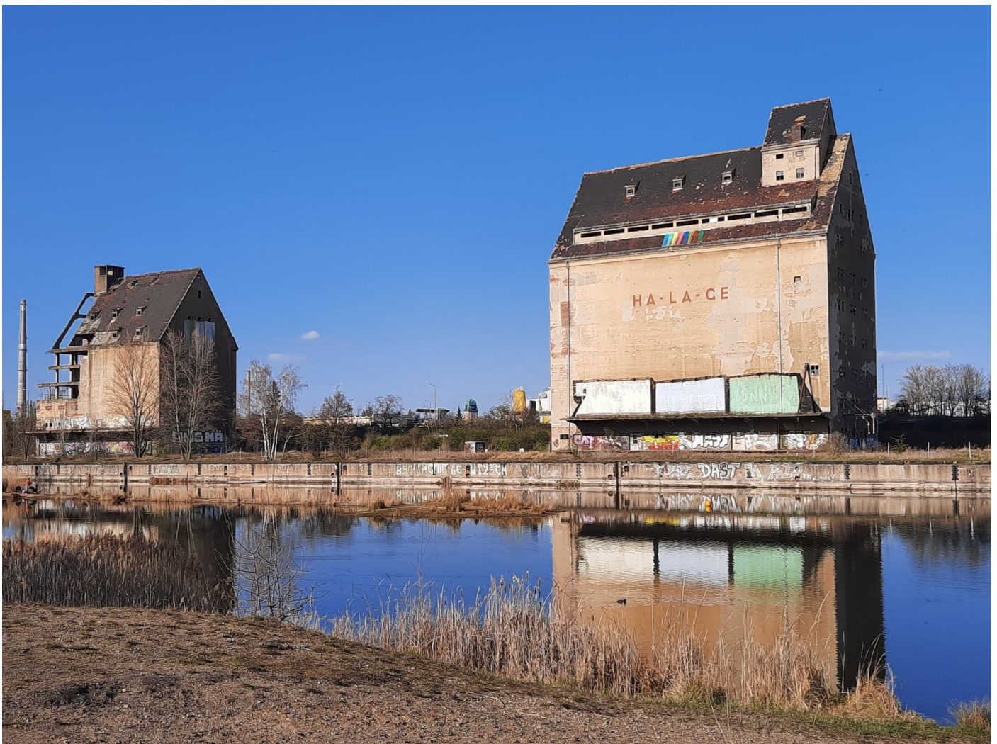
Am Lindenauer Hafen

Ursprünglich sollte der Elster-Saale-Kanal die Stadt Leipzig mit den Weltmeeren verbinden. Leider wurden die Bauarbeiten in den 40iger Jahren des letzten Jahrhunderts eingestellt. Eines der größten Relikte aus jener Zeit ist der Lindenauer Hafen in Leipzig, wo unsere Radtour beginnt. Vom Parkplatz fährt man die Straße ca. 150 Meter zurück. Unmittelbar nach dem Überqueren einer alten Gleisanlage zweigt nach links ein Radweg entlang der ehemaligen Bahntrasse ab. An dessen Ende überquert man einhundert Meter westlich die Lyoner Straße in einer markanten Kurve. Geradeaus folgt man nun den Schildern zum Bootsverleih und nach wenigen Minuten steht man am Elster-Saale - Kanal. Die Strecke führt jetzt auf mehr oder weniger gut ausgebauten Wegen bis zum Ende der Wasserstraße.