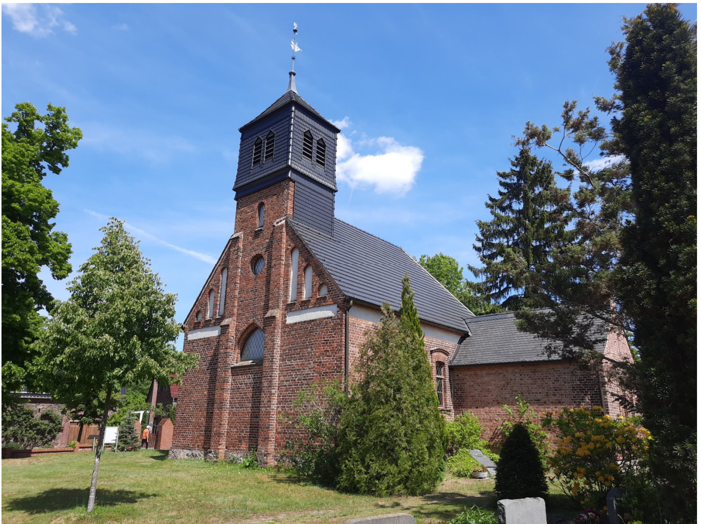
Schmucke Kirche in Reichenwalde

Von Storkow führt unsere Radstrecke nun am Ostufer des Dolgensees auf einem asphaltierten Weg durch den Wald. Am GPS-Punkt N52° 15.516', E13° 57.792' gabelt sich der Weg. Rechts gelangen wir nach rund 800 Metern zum Wolfswinkel, einer schönen Badestelle mit kleinem Imbiss. Wir halten uns an der Gabelung links und fahren wenig später vorbei an einem Campingplatz nach Dahmsdorf. Im Ort stoßen wir am Wegpunkt N52° 14.168', E13° 59.651' auf die Landstraße von Reichenwalde. Hier biegen wir rechts ab und fahren etwa 3 Kilometern bis Wendisch Rietz. Im Ort folgen wir den Wegweisern zum Bahnhof. Dort überqueren wir die B246 und benutzen den bequemen Radweg nach Osten. Nach gut einem Kilometer überqueren wir die B246 erneut und fahren entlang von Ferienhaussiedlungen wieder nach Norden. In Diensdorf-Radlow lädt die Alte Schulscheune zu einem Besuch ein. Ganz in der Nähe lädt eine Badestelle zu einem Sprung in das erfrischende Nass des Scharmützelsees ein. Entlang wenig befahrener Wege und Nebenstraßen gelangen wir zurück nach Bad Saarow zum Ausgangspunkt der Tour.