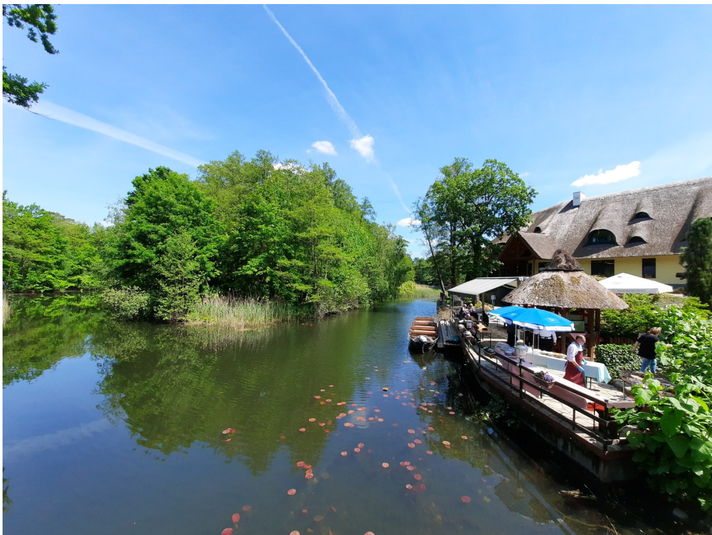
Beim Fischer in Wendisch Rietz

Im Dreieck zwischen Bad Saarow, Storkow und Wendisch Rietz liegen einige der schönsten Seen östlich von Berlin, Wir beginnen unsere Tour in Bad Saarow an der Kurpromenade und folgen zunächst der L412 in Richtung Wendisch Rietz. Am Wegpunkt N52° 17.053', E14° 02.286' biegen wir nach links ab. Der Fahrweg führt häufig durch Sand und über Wurzeln. Wer es einfacher haben möchte, fährt die L412 weiter bis zum Kreisverkehr und benutzt dort die Teerstraße nach Reichenwalde. Ein bequemer Radweg führt von Reichenwalde entlang der Straße bis nach Storkow.